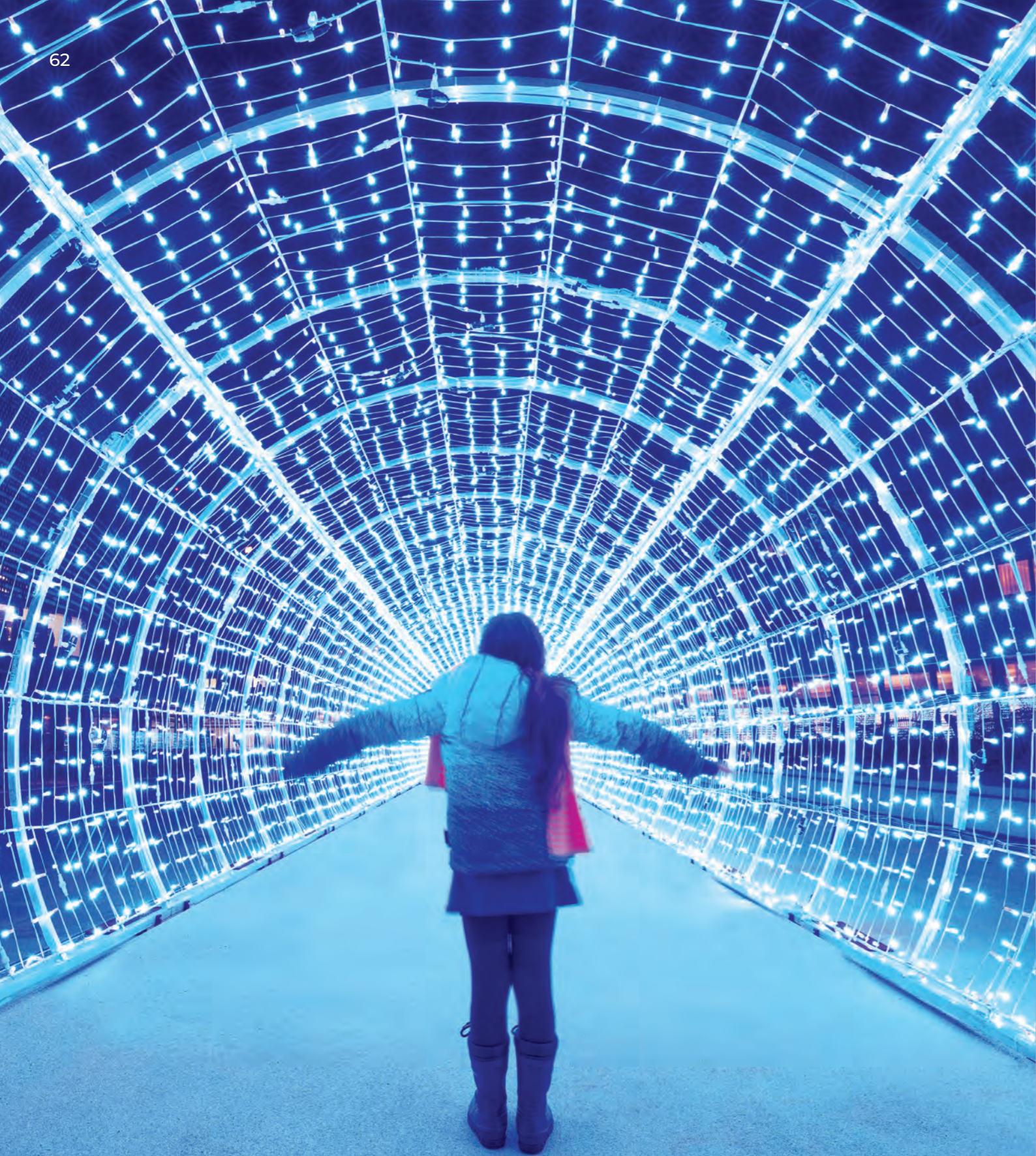
Aquatis, Lausanne, Switzerland