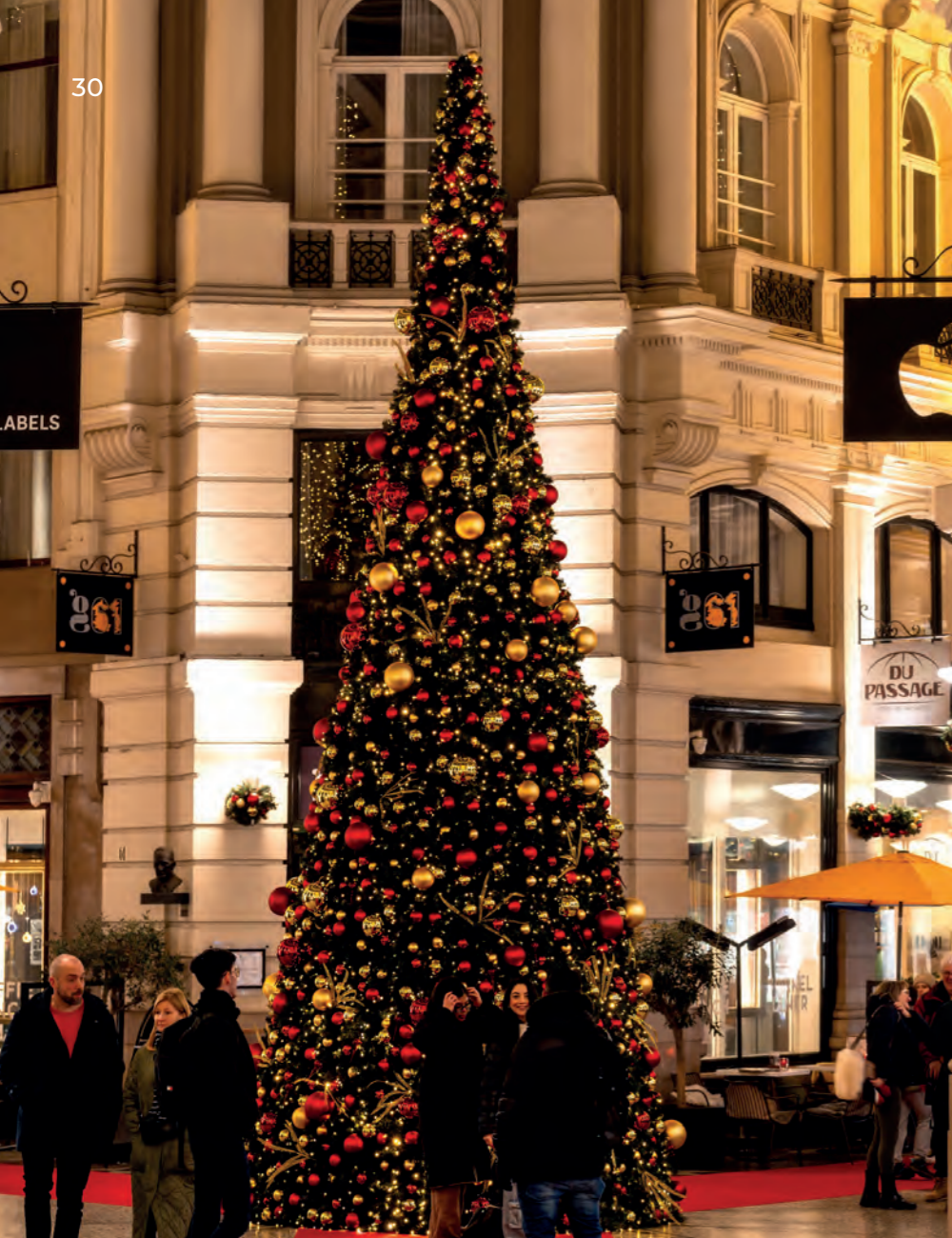
Passage, Den Haag, the Netherlands