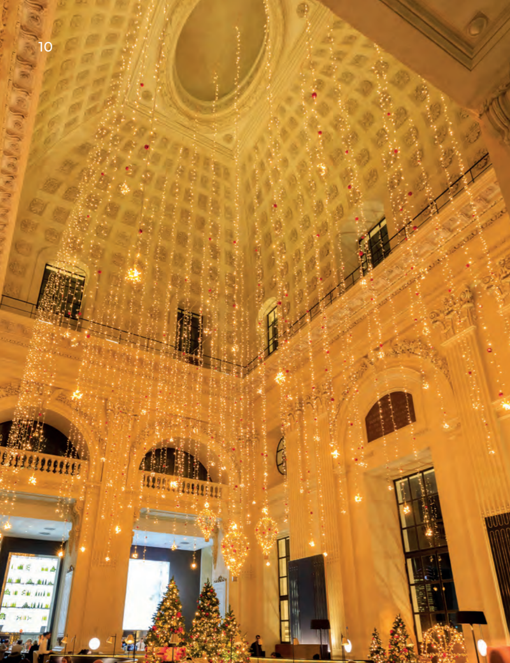
InterContinental - Hotel Dieu, Lyon, France