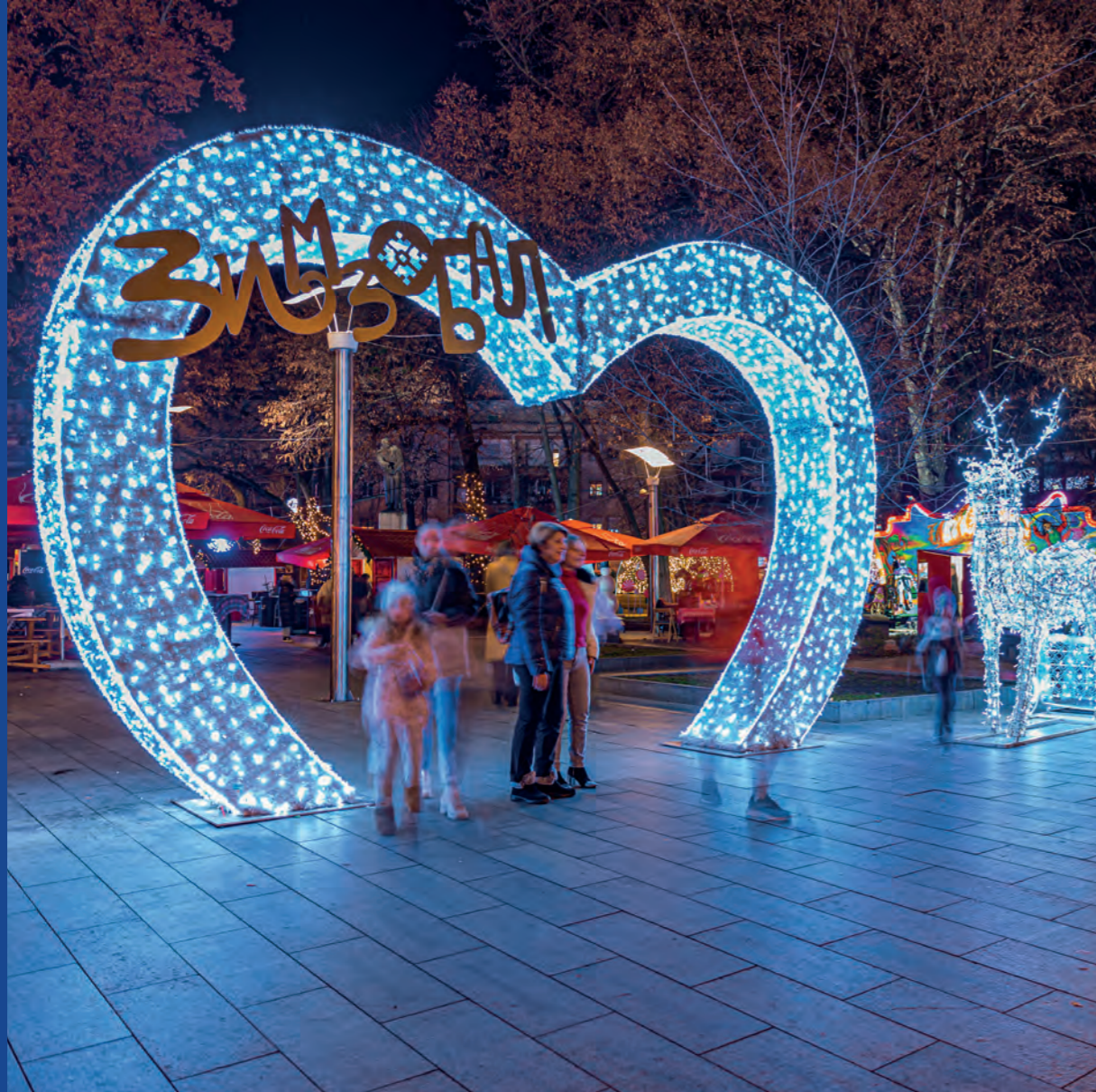
Banja Luka, Bosnia and Herzegovina