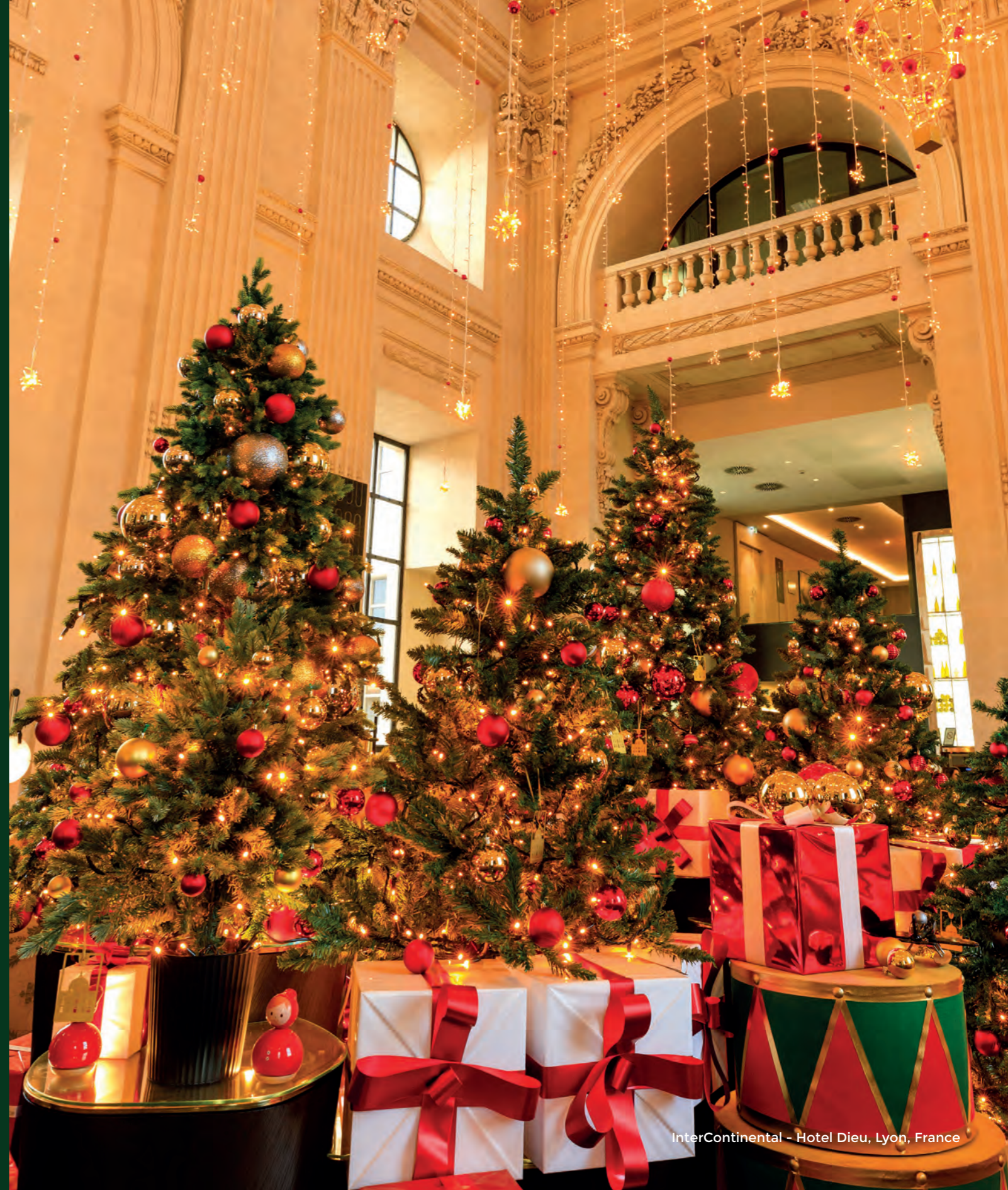
InterContinental - Hotel Dieu, Lyon, France