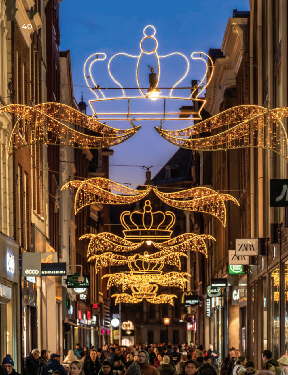
Nieuwendijk, Amsterdam, the Netherlands