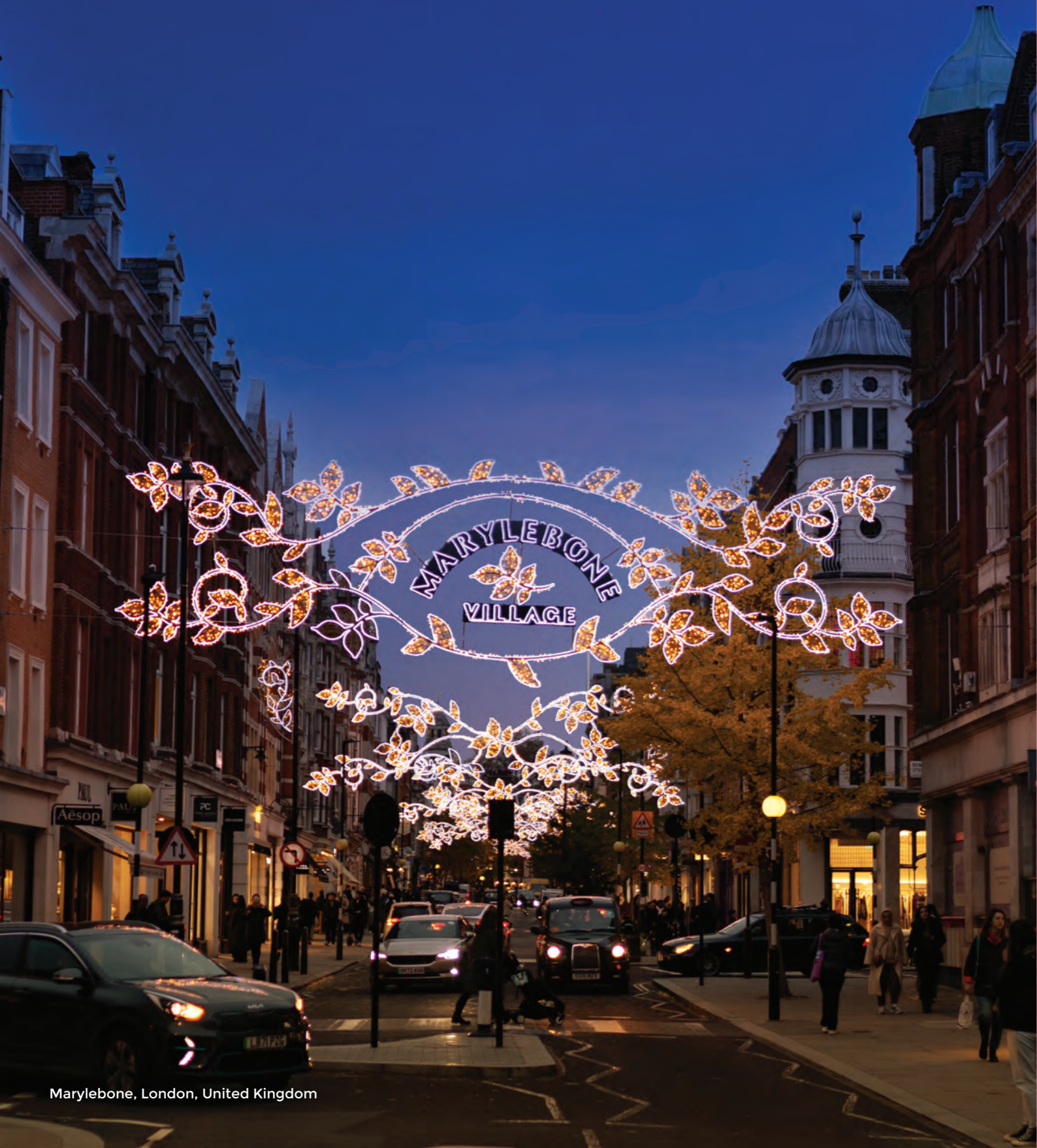
Marylebone, London, United Kingdom