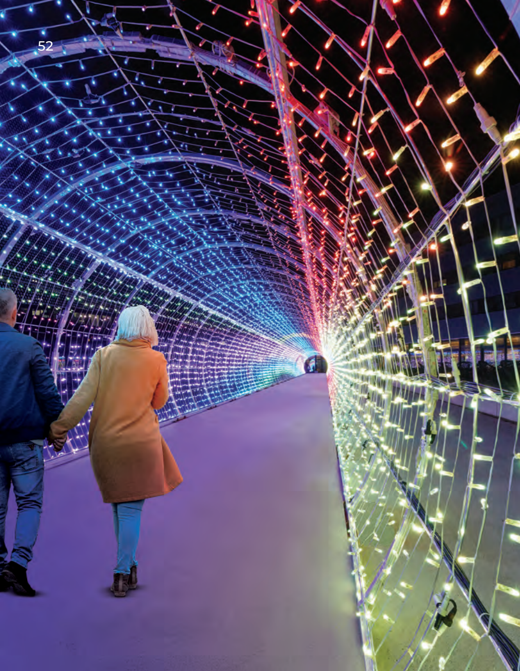
Aquatis, Lausanne, Switzerland