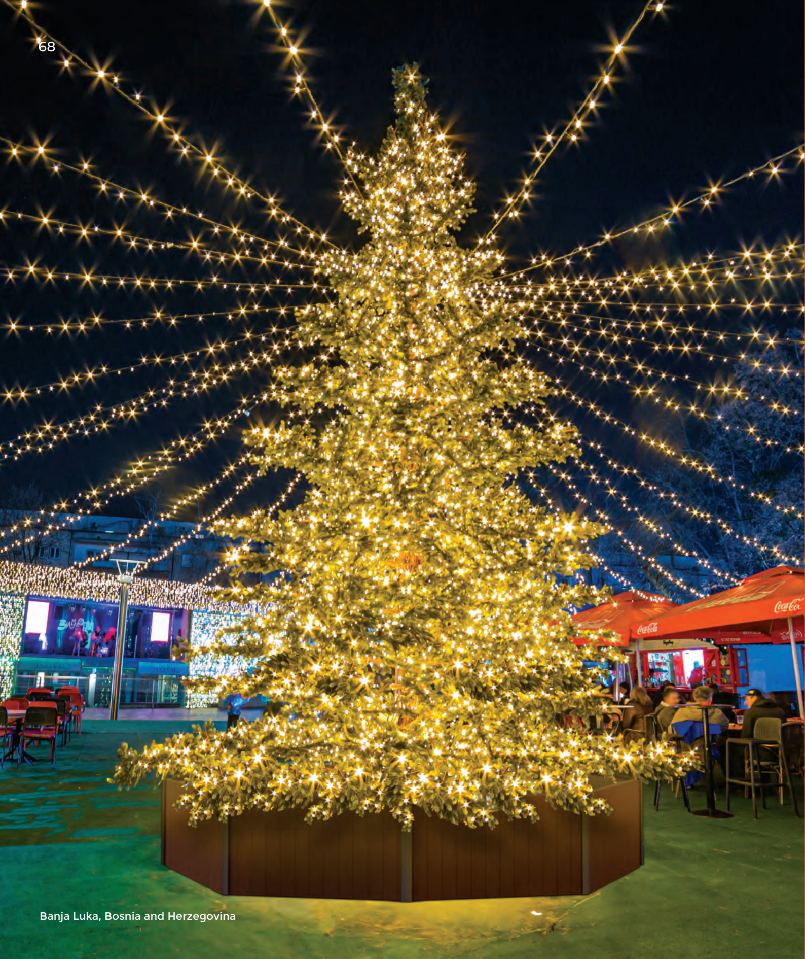
Banja Luka, Bosnia and Herzegovina