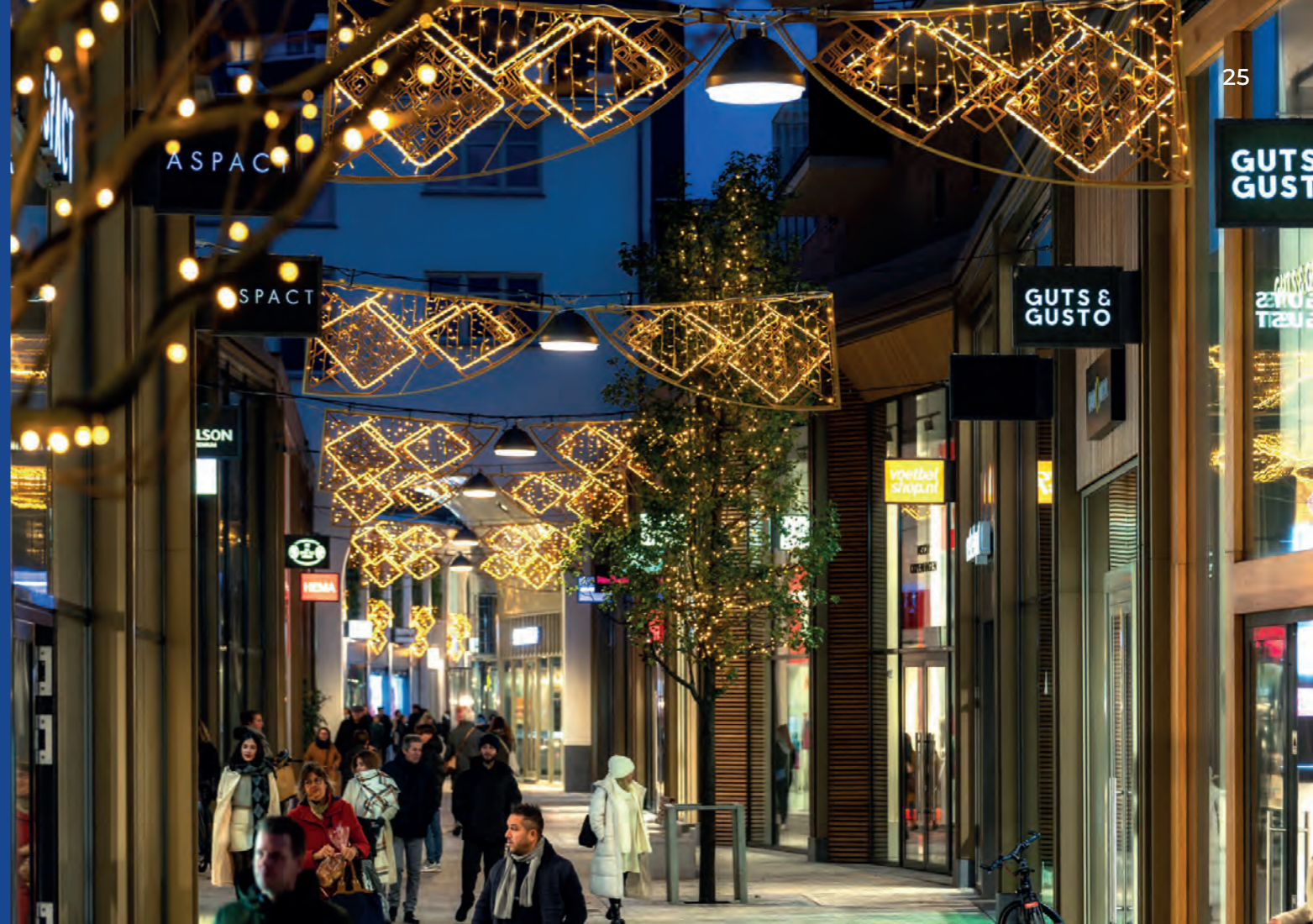
Tilburg, the Netherlands