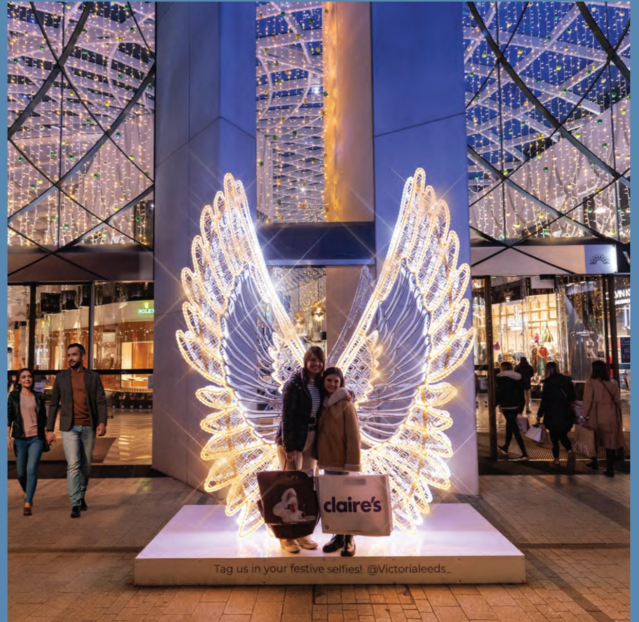
Victoria Leeds, United Kingdom