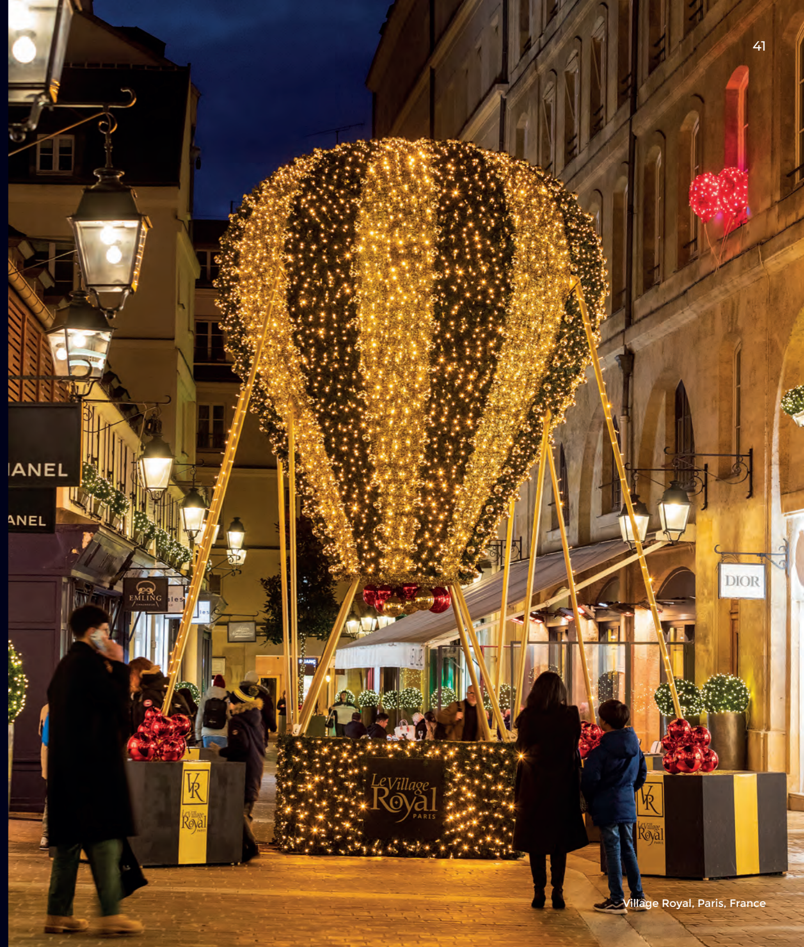
Village Royal, Paris, France