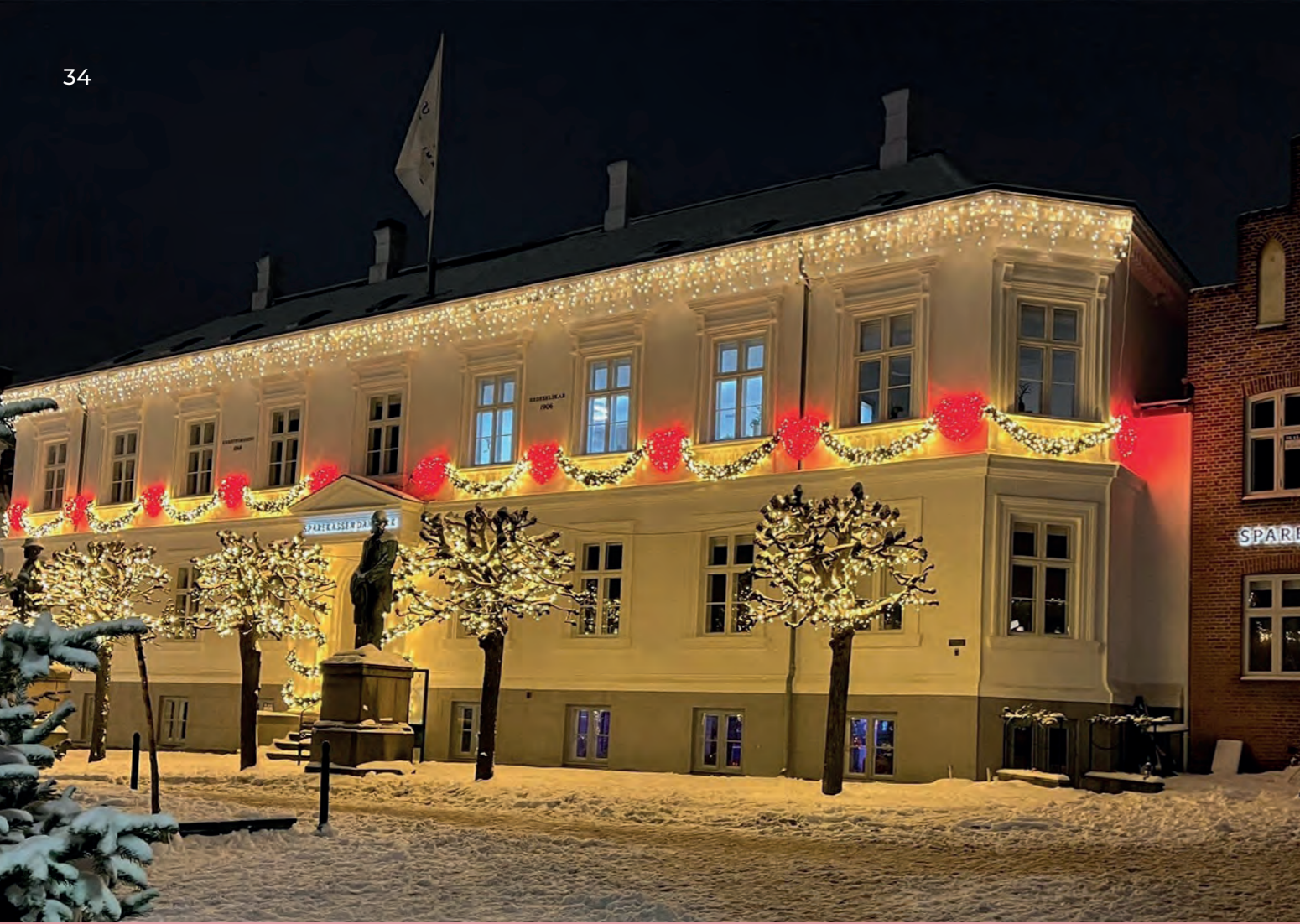
Sparekassen Danmark, Viborg