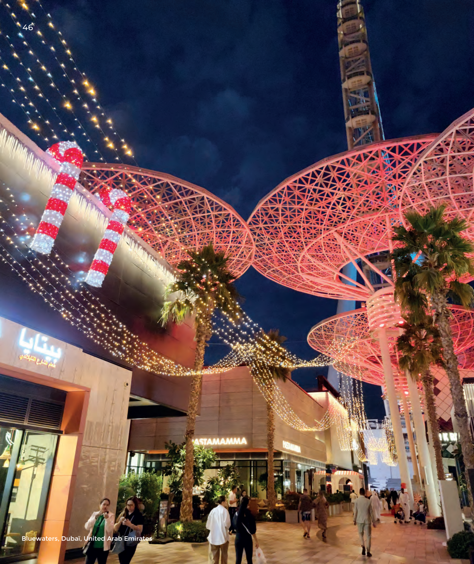
Bluwaters, Dubai, United Arab Emirates