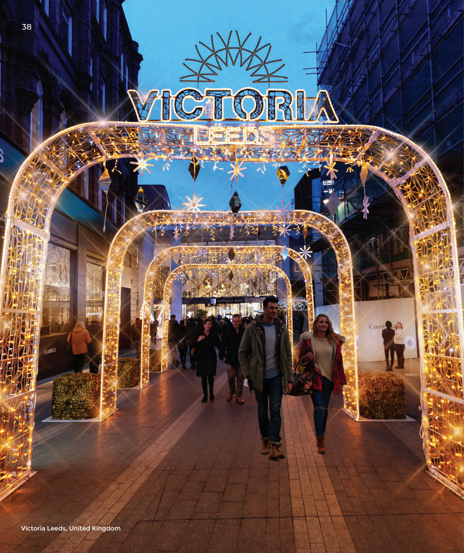
Victoria Leeds, United Kingdom