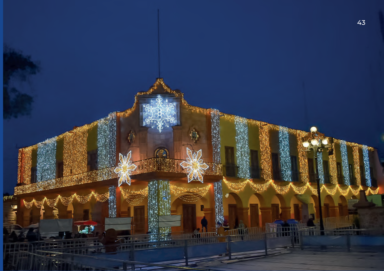
Dolores Hidalgo Cuna de la Independencia Nacional, Guanajuato, Mexico