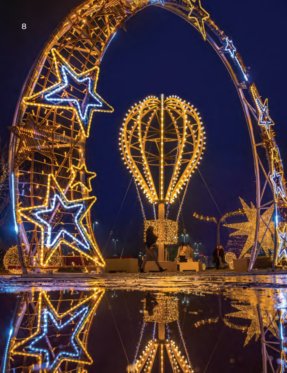
Arena Centar Shopping center, Zagreb, Croatia